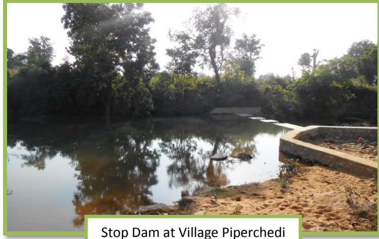
Stop Dam at Village Piperchedi